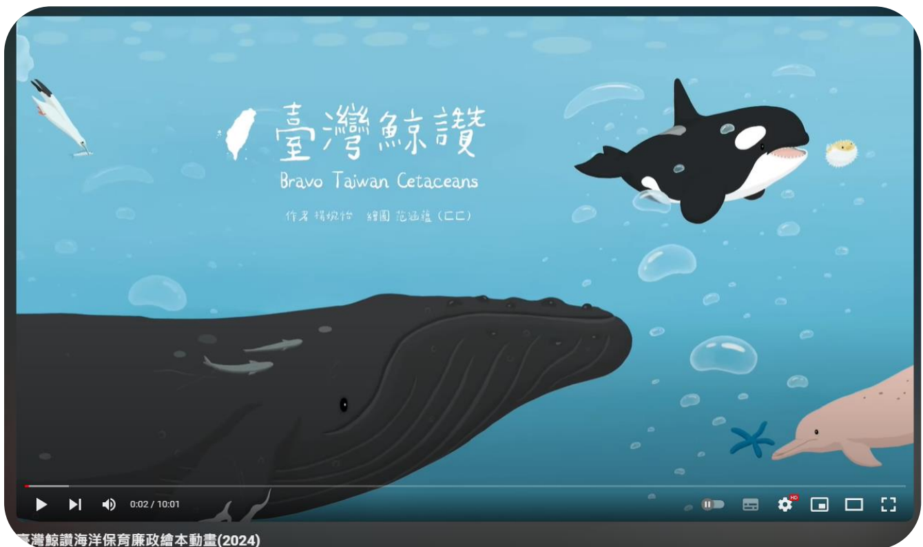
臺灣鯨讚海洋保育廉政繪本動畫(2024)

動畫短片已上傳於海洋保育署 YouTube 頻道（網址連結： https://www.youtube.com/watch?v=aLNwpqXGJ9M ），歡迎同仁踴躍點閱。