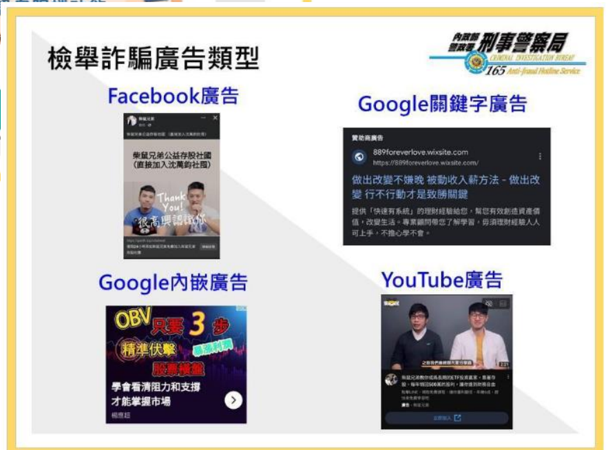
民眾在 FB、Google、YouTube 發現詐騙廣告皆可檢舉。