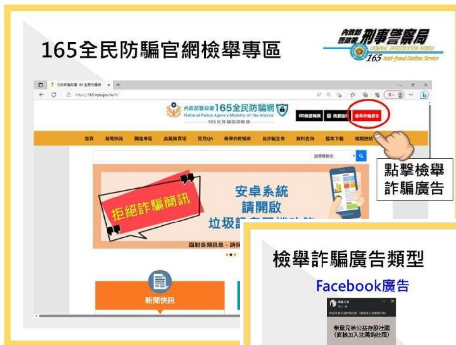
165 官網增設檢舉詐騙廣告平台。

為了儘速蒐集這些詐騙廣告，內政部警政署刑事警察局(下稱刑事局)於 165 全民防騙官網 ( https://165.npa.gov.tw/ ) 增設檢舉詐騙廣告平臺，提供民眾針對 Facebook、Google 及 YouTube 所看到的詐騙廣告做檢舉，相關的檢舉教學都能在填輸資料時查看，刑事局收到檢舉資料後，會儘速通報平臺業者執行下架事宜。