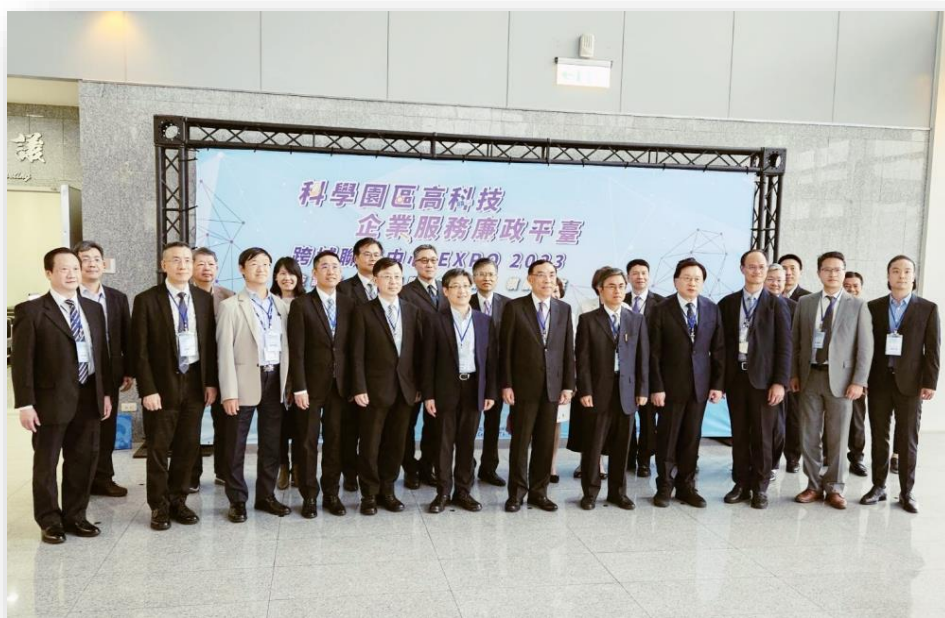
▲法務部部長蔡清祥、國科會陳宗權副主委及中科管理局許茂新局長與多位園區企業代表暨檢調單位高階主管，於中部科學園區管理局「科學園區高科技企業服務廉政平臺跨域聯繫中心 EXPO 2023」活動合影。

本會與法務部未來將廣續攜手合作推動「科學園區高科技企業服務廉政平臺」，並積極透過溝通聯繫及跨域合作機制，凝聚公私部門共識，跨域攜手合作共創誠信優質投資環境，共同達成國家經濟永續發展的目標，帶動科技產業經濟價值與誠信治理的對話機會，深具正面意義。