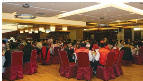
商務會館之總理大餐廳。