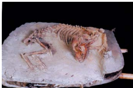
台南園區南關里遺址出土犬類。

南科台南園區考古遺址見有完整的犬類骨骸出土，顯示犬隻一直為史前人類所飼養，其中屬大空坑文化的南關里遺址及南關里東遺址所出土者為現今台灣年代最早的犬。