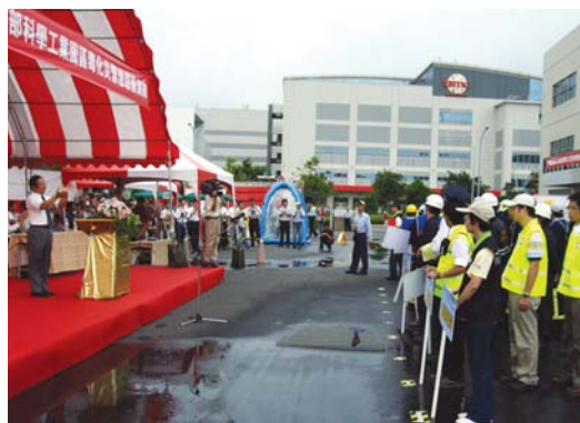
97年「南部科學工業園區毒化災緊急應變」演練逼真，獲得高度肯定。

南科管理局結合國安、調查、警安、災害防救組織、園區同業公會及重要公用事業等單位，於92年11月8日成立緊急應變聯防組織，增強區域聯防功能。94年11月更建置完成全國第1個緊急應變決策支援專家系統，勞委會並於95年7月20日頒發「安全衛生傑出研發成果推廣獎」。