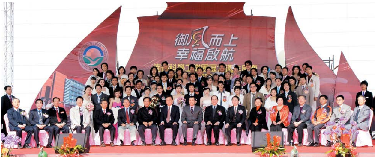
98年1月10日南科管理局六週年局慶暨南科集團結婚，馬英九總統親臨證婚與新人大合影。