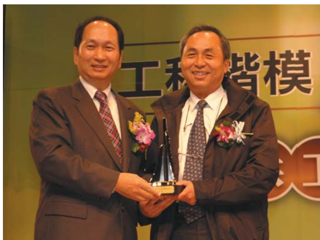
陳俊偉局長（右）代表接受第8屆公共工程金質獎。