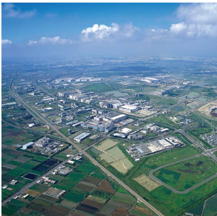
97年空照圖俯瞰台南園區產業聚落，聚集眾多國內外廠商。

自86年奇美進駐南科後，南科是台灣第一個有計畫地推動光電產業的科學園區，南科的面板產業，是全世界垂直整合最完整的聚落，包括材料、設備、製程技術，同時品牌商業策略也聚集於園區內。98年6月止，光電聚落已吸引45家廠商進駐，其中有11家日商、3家美商，97年年產值已逾4,000億元，占世界光電產業產能舉足輕重地位。