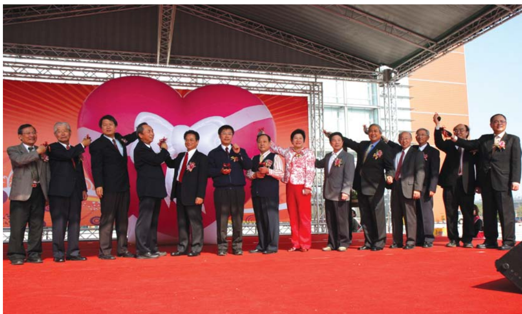
97年1月20日南科管理局五週年局慶，歡慶營業額及從業人數創新高，嘉賓雲集慶賀。

自92~97年期間，南科年產值最高峰曾創下5,588.7億元，年複合成長率28.7%。年產值以光電產業的4,026.7億元貢獻最多，其次則是積體電路產業創造了1,302.1億元。另外，從業人數最高峰達54,115人，年平均成長29%，對國家及地方經濟發展效益顯著。