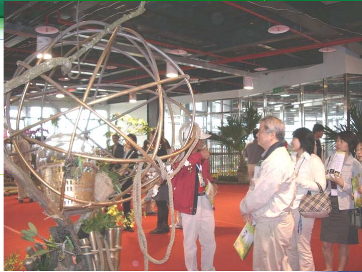
蘭花展覧会の様子