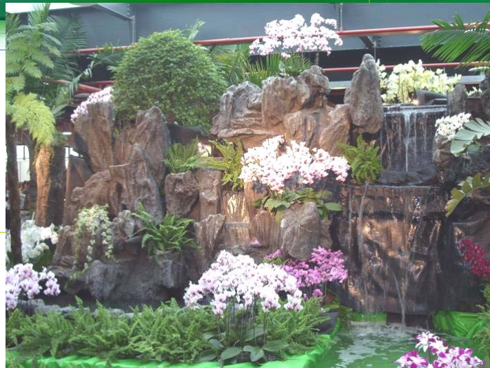
奇麗な蘭花が咲いている