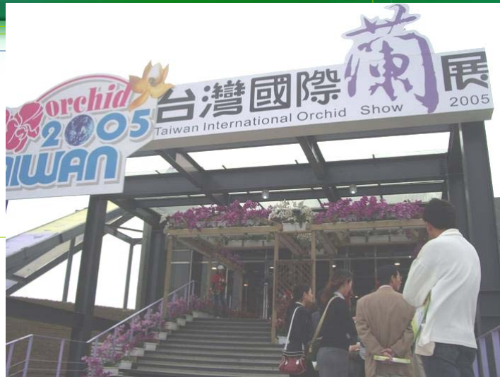
台湾蘭花展覧会見学