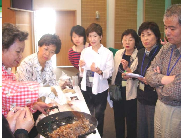
まず材料を炒める