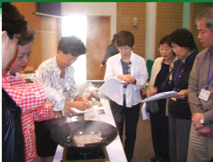
先生が作り方を教える