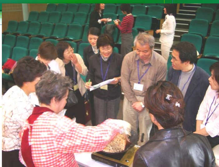
直ちに甘・塩台湾粿に変身