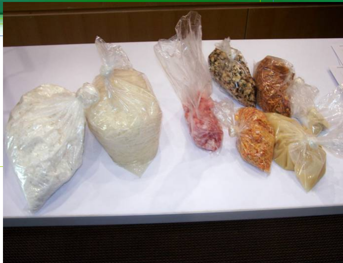
多種多様な粿の原料