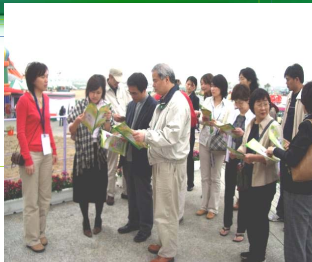
入り口でまず説明を聞く