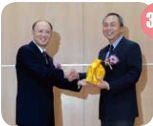
■ 科技部常務次長陳德新(左)將印信交給新任局長陳俊偉(右)