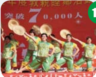
■ 媽媽們精彩有活力的演出為局慶加入更多元氣