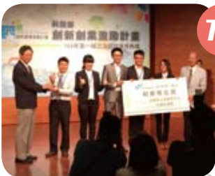
■ 前科技部部长張善政(左1)頒發獎盃及200萬元創業金給「動能之星」創業團隊