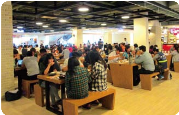
■ 台南園區Park17商場裝修後明亮舒適