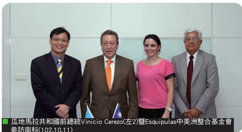
瓜地馬拉共和國前總統 Vinicio Cerezo(左2)暨 Esquipulas 中美洲整合基金會參訪南科(102.10.11)