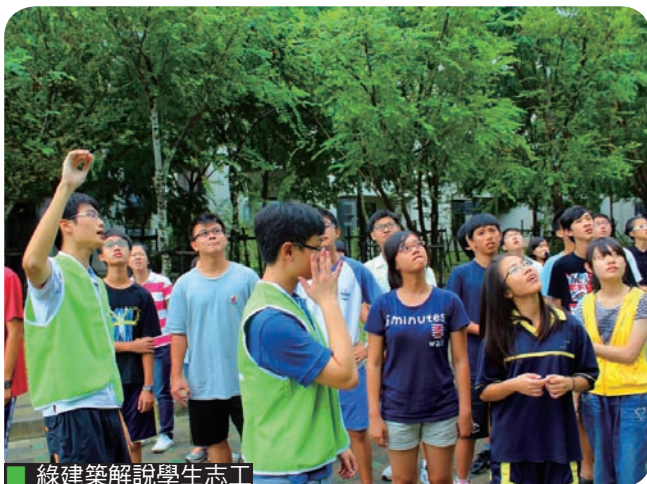
綠建築解說學生志工