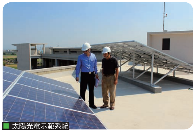
太陽光電示範系統