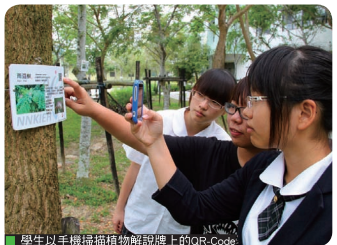
學生以手機掃描植物解說牌上的QR-Code