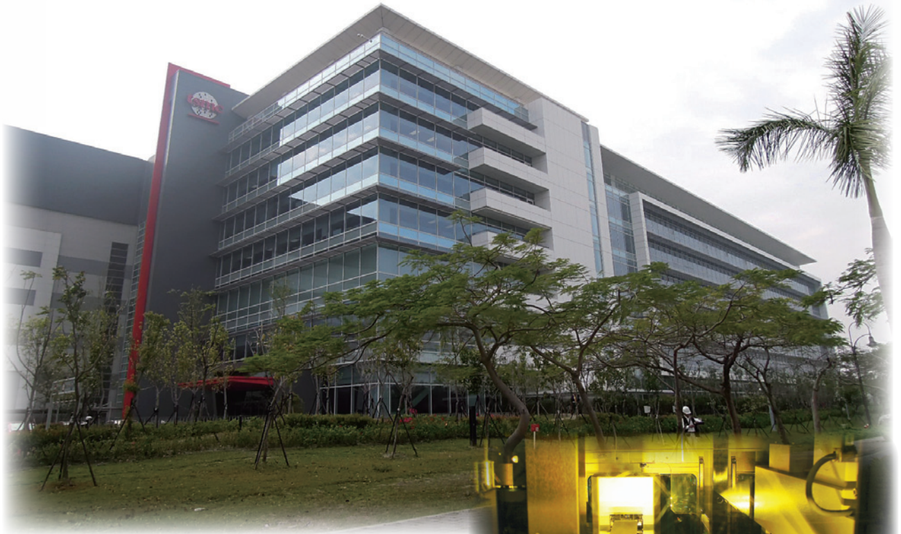
■ 台南園區之台積電 14 廠 Fab P3 棟 12 吋晶圓廠