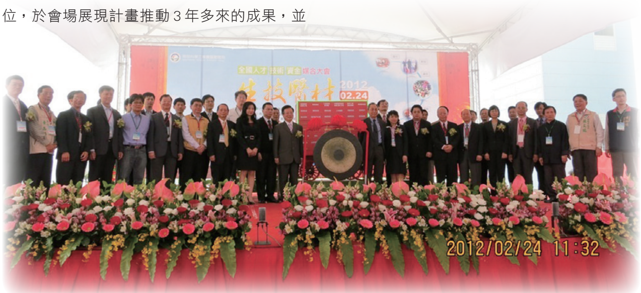
■ 醫材牛墟開市—全國人才、資金、技術媒合大會 (101.02.24)

南科致力引進綠能產業，主要包括太陽能、LED、鋰電池及電動車產業。101 年底止，太陽能產業已引進 11 家大廠，LED 產業引進 6 家廠商，電動車產業則引進 2 家廠商。而為強化太陽能測試驗證能量，同時引進了核能研究所設置聚光型太陽能發電高科驗證與發展中心，提供技術並訂定出檢測規範，建立符合國際規範的驗證制度。電信技術中心在高雄園區建置綠色通訊實驗室，可縮短國內廠商品質安規認證時間，增進國際競爭力。