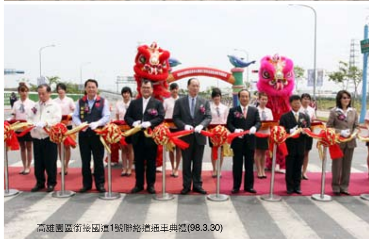
高雄園區銜接國道1號聯絡道通車典禮(98.3.30)