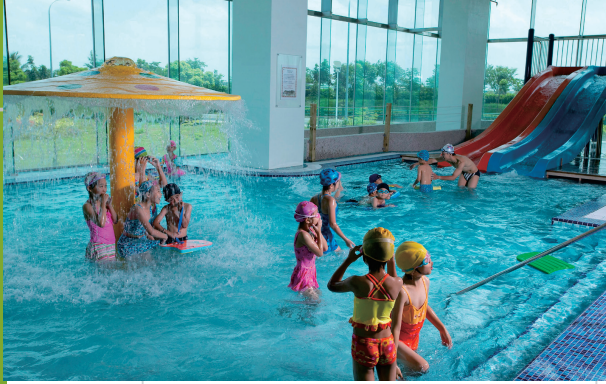
▲健康生活館的室內溫水游泳池。