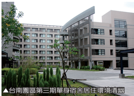
▲台南園區第三期單身宿舍居住環境清幽

位於台南園區西南角的西南區滯洪池公園，佔地約7公頃，於97年5月啟用。整座公園以「仿古式閩南庭園」為設計主調，完美塑造出台南閩式庭園之湖泊景