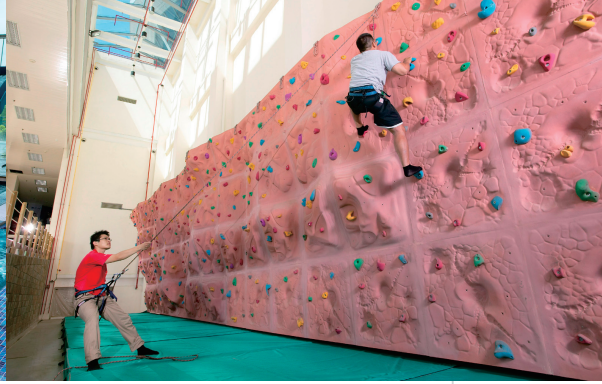
▲健康生活館內的室內攀岩場