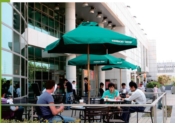
▲統一商場(Park 17) 希望以更優質的服務來吸引更多消費者