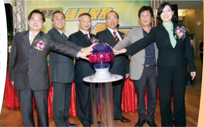
通關服務E網通系統正式上線啓用(12月12日)

為提供園區廠商、儲運單位、郵局及報關業者多元入口申辦管道，針對簽證、進倉及報單三合一通關作業，於96年7月由三園區共同建置完成通關服務E網通系統，96年12月12日正式上線啓用，提供申辦、審核、管理及服務通關自動化，並與國貿局「便捷貿E網」介接整合。透過新系統電子申報作業，通關速度由平均20分鐘縮短為7分鐘，並具有異地備援功能及緊急應變措施，避免業者存貨積壓成本，節省通關作業處理時間。