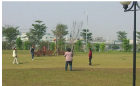
璞園主管宿舍四周環境

為美化園區整體觀瞻，於部分未出租土地依季節種植向日葵、波斯菊等景觀綠肥作物，每逢開花時節，多樣化的花海美不勝收；另為利園區生態永續發展及供園區廠商綠美化心得交流，計舉辦4場園區綠美化技術講習會。