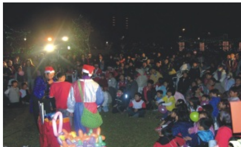
璞馨公園聖誕晚會盛況(12月23日)