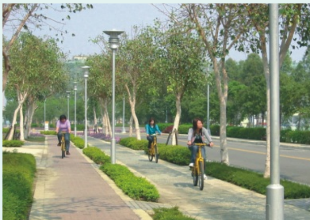
台南園區愛心自行車