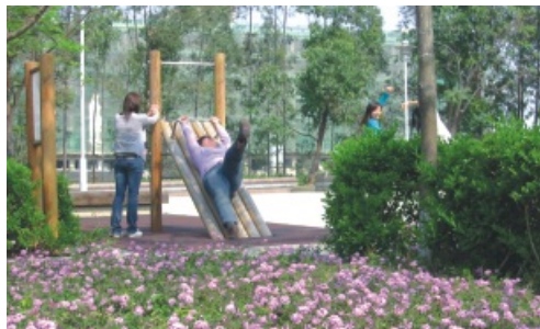
馨園有眷宿舍四周環境