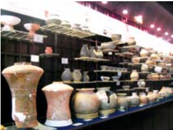
图 2-12 考古文物陳列室古物