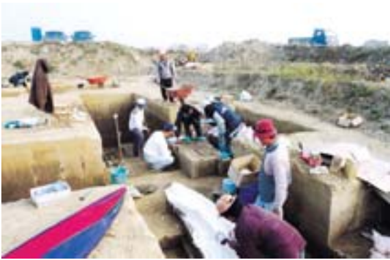
图 2-11 文化遺跡保存現場

文化遺跡を救う過程で、学術単位に実習体験を提供した他、2002年9月までに一部が完成し約30坪の考古文物陳列室に陳列展示して民衆に余暇と開拓知性の旅を提供した。