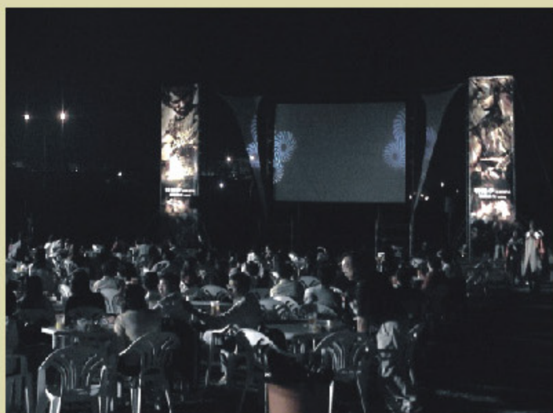
> 湖濱雅集-「トロイ」屋外映画祭(10月28日)