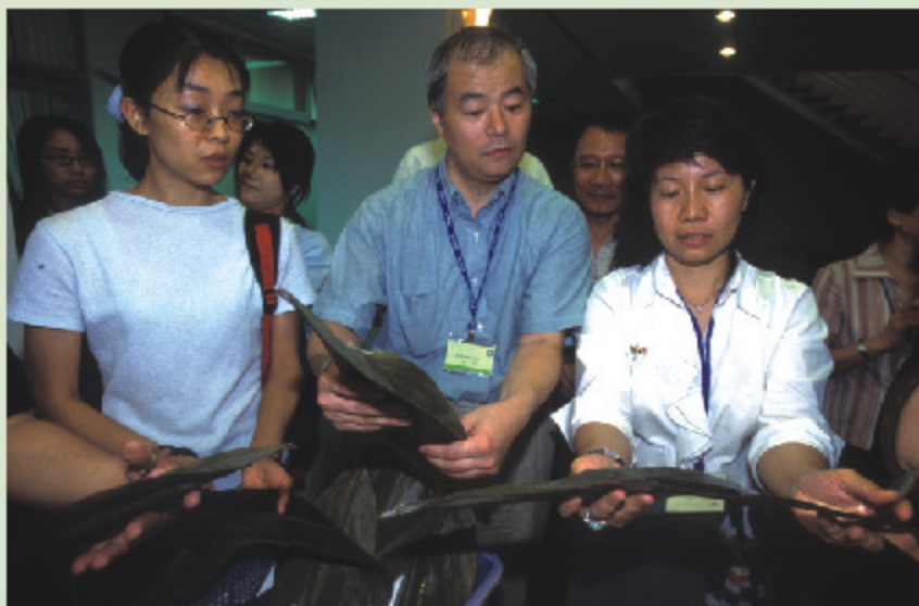
> 端午の節句にて日系企業粽作りイベント(6月19日)