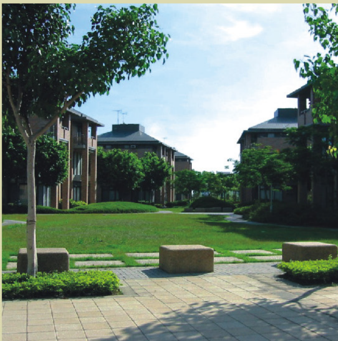
> 第一期VIP管理職用宿舍

2004年3月に続けて休暇緑地区域・歩道・景観パビリオン・曲橋施設を設置した親水景観公園、西拉雅広場・霞客湖・道爺湖と迎曦湖等が完成される。西拉雅広場内には大小各種演劇場あり、規模や性質の異なる各種イベントや演劇の使用に提供できる。本管理局と園区企業は2004年8月・10月と11月の間にそれぞれ南科ビール祭り・屋外映画鑑賞会・音楽会を開催し、また、各界に開放し各種文芸・休暇イベントの開催場所を提供している。2004年12月1日から本管理局は特別に釣り許可証を発行し、各景観湖での釣りを開放し、園区従業員は湖畔での優雅な釣りを享受できるようになった。