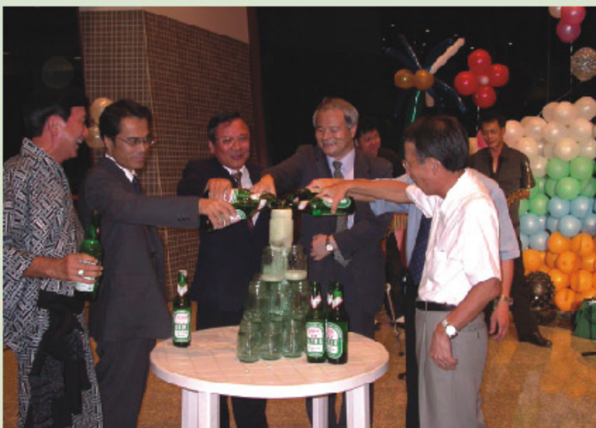
> 日系企業従業員によるビール祭り(8月27日)