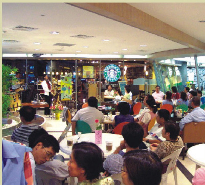
> 春季音楽祭臨場感溢れる演奏会(5月17日)