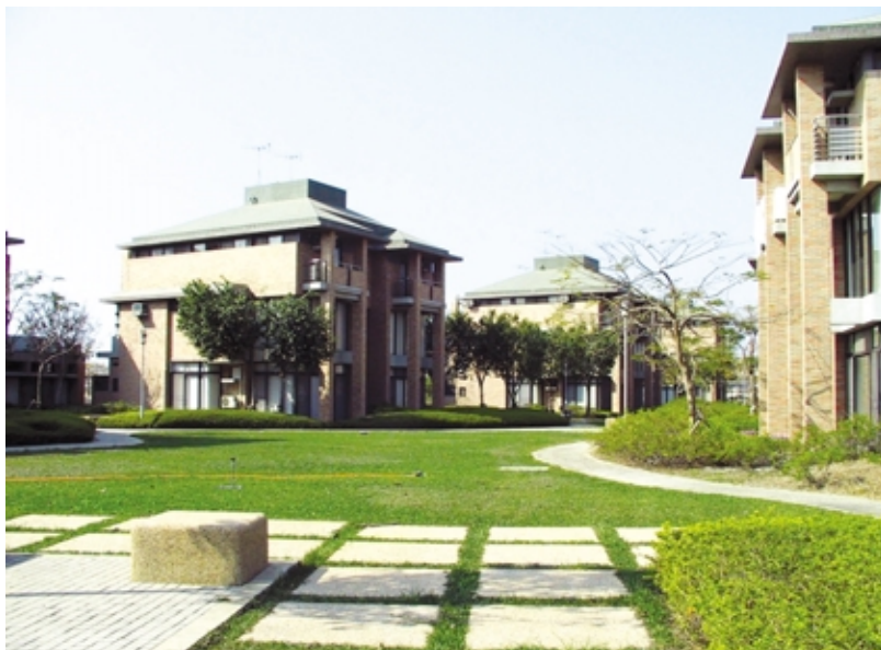
圖 5-5-6 璞園(台南園區主管宿舍)

路竹園區興建中之第一期標準廠房，為地下二層、地上五層鋼結構建築二棟共40單元，每個單元約180坪，預定於九十三年六月底完工。