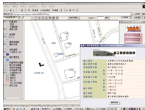
圖 5-5-4 地理資訊系統