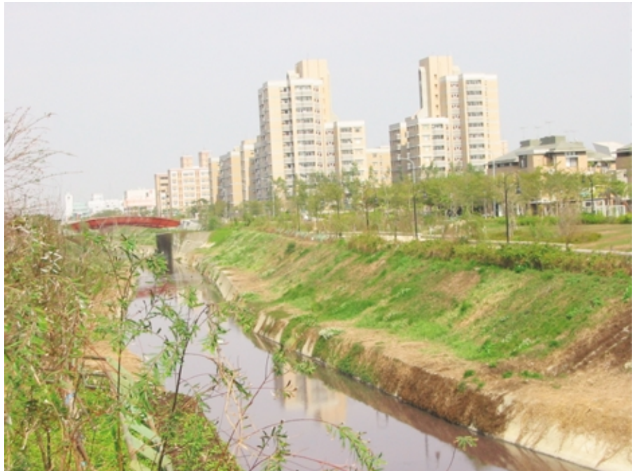
圖 5-5-3 防洪排水整治成效

為充分利用公有場地，修訂公有場地使用管理要點提供園區事業借用，並訂立認養公共場地管理機制，希藉由園區廠商回饋公益服務，提昇園區生活環境。另建立建築物及公用設施故障維修通報機制、提昇景觀植栽維護效益並降低成本，建立整潔美觀高效能園區。