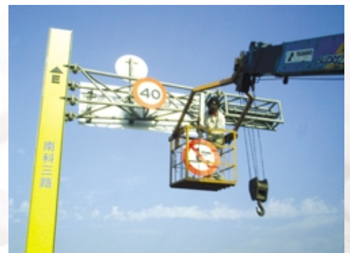
圖 5-5-5 設施維護工作