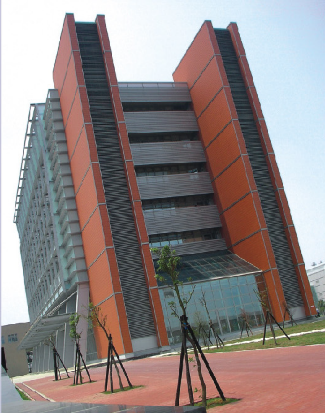
> 行政大樓(94年1月完工)